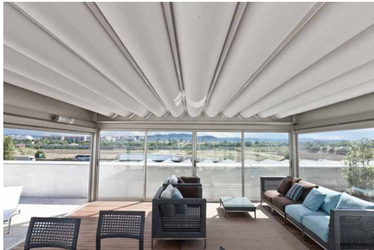
The Outdoor Alchemist